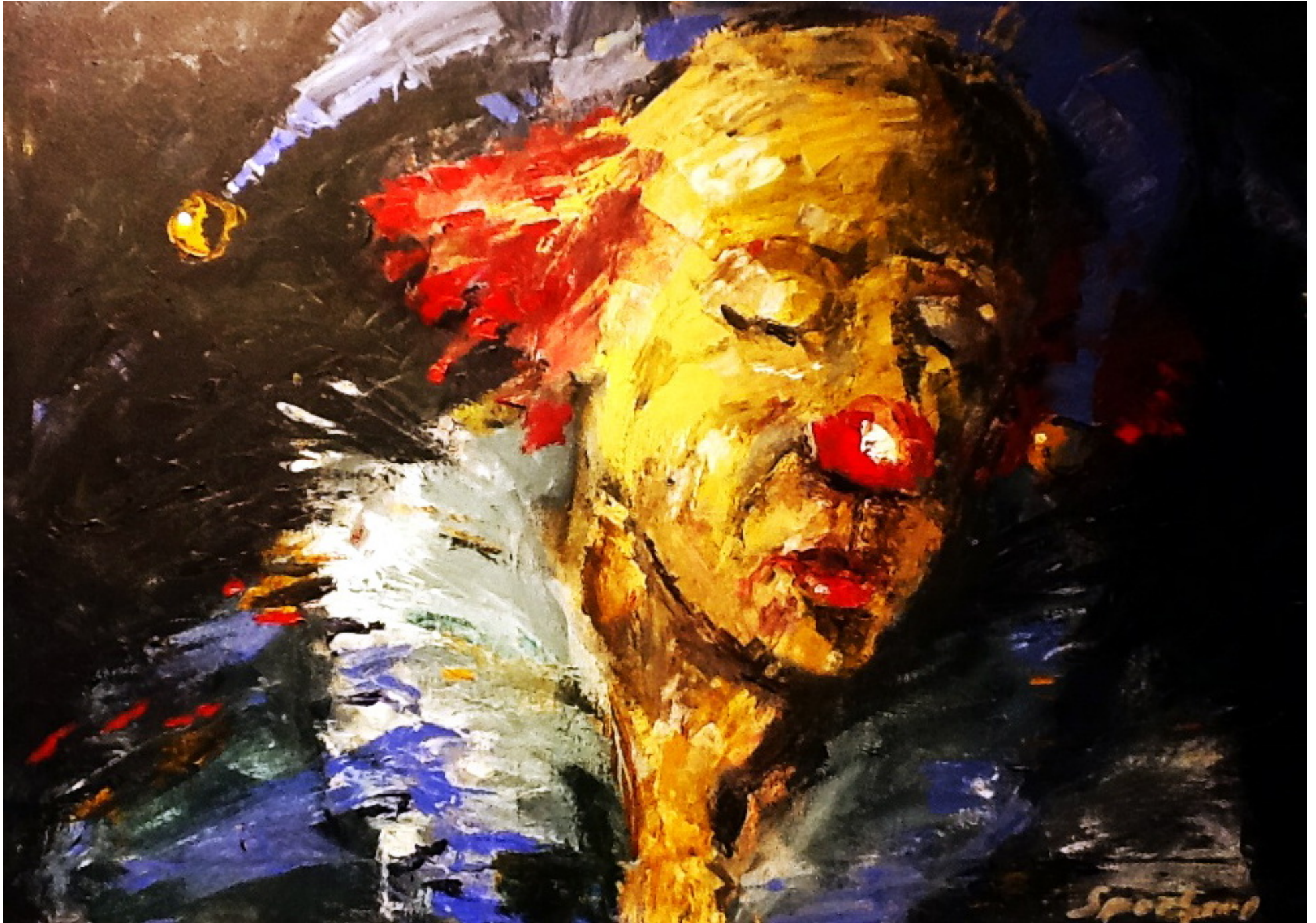
Harlekin in trauriger Selbstbetrachtung ( verkauft) Olaf Sporbert

Die Werke der Ausstellung können erworben werden. Wir können Ihnen bei Bedarf eine Preisliste Senden.