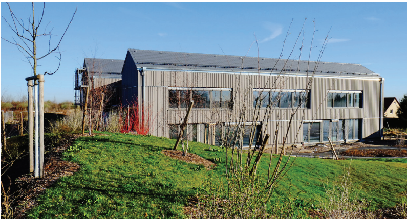
Ansicht Süd Kita Altfranken

Unter dem Motto „Architektur schafft Lebensqualität“ sind alle Interessierten herzlich eingeladen mehr über aktuelle Architektur zu erfahren. Vom 24.06. - 25.06. finden deutschlandweit Objektbesichtigungen, Bürobesichtigungen und Veranstaltungen statt. Das gesamte Programm finden Sie unter www.tda.aksachsen.org .