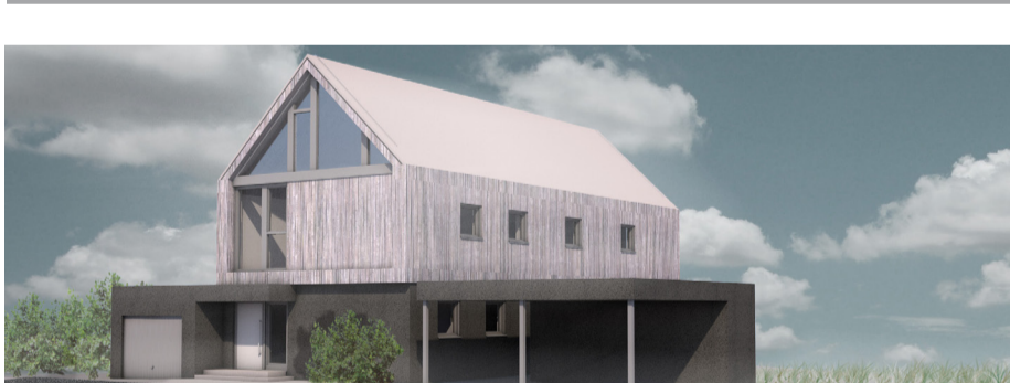
Perspektive mit Holzfassade