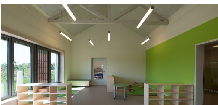
Gruppenraum im Obergeschoss