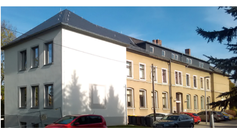
Ansicht mit neuem Anbau