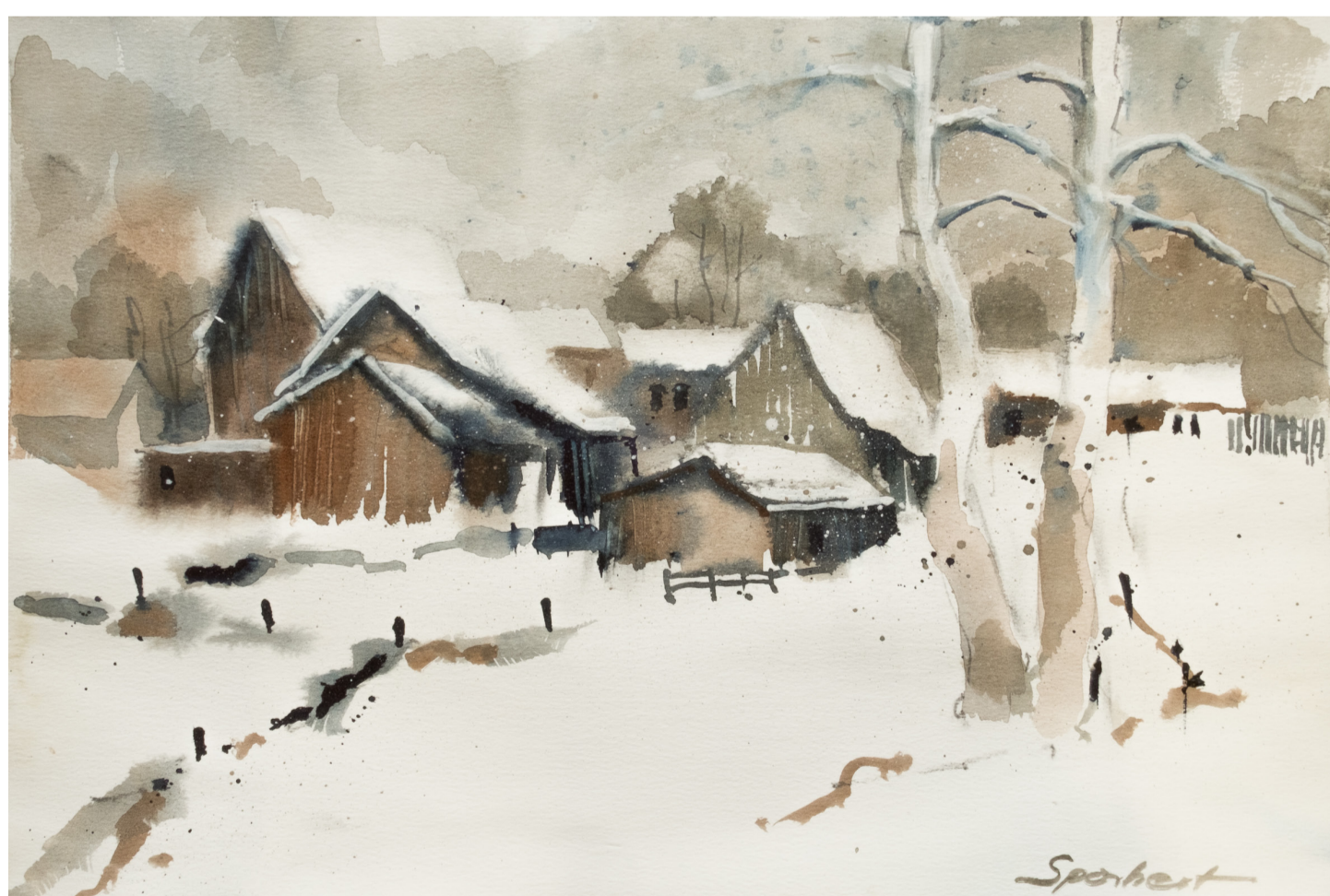
„Schnee im Gebirge“ - Olaf Sporbert, Aquarell

Wir blicken optimistisch auf das neue Jahr und freuen uns, gemeinsam mit Ihnen, auf die kommenden Aufgaben. Gleichzeitig bedanken wir uns bei unseren langjährigen und neuen Geschäftspartnern für das entgegengebrachte Vertrauen und die angenehme und erfolgreiche Zusammenarbeit im Jahr 2017. Wir wünschen Ihnen ein schönes Weihnachtsfest im Kreise Ihrer Lieben und die Zeit, um Kraft für die anstehenden Herausforderungen sammeln zu können.